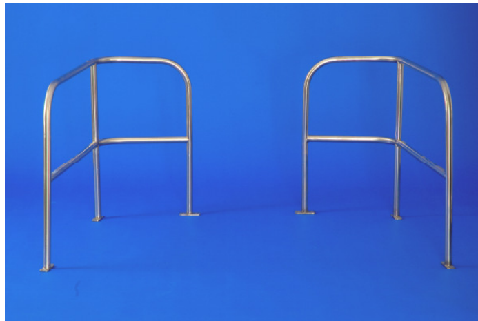
Heckkorb, 2- teilig

Gerne nehmen wir Ihren alten Heckkorb als Muster und übernehmen kostenlos die anschließende Entsorgung.