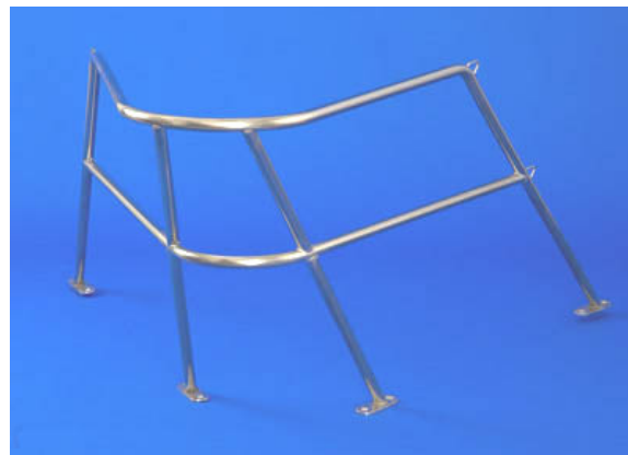
Bugkorb Modell KH

Gerne nehmen wir Ihren alten Bugkorb als Muster und übernehmen kostenlos die anschließende Entsorgung.